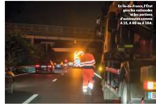
En Île-de-France, l'État gère les nationales et les portions d'autoroutes comme A 15, A 86 ou A 104.

Depuis juillet 2016, toutes les routes d'Île-de-France sont limitées à 110 km/h au plus (hors les portions d'autoroutes du réseau à péage, ndr). Mais il