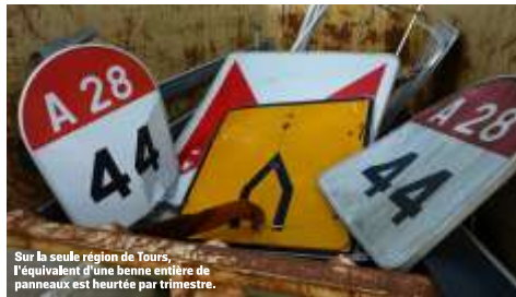
Sur la seule région de Tours, c'est l'équivalent d'une benne entière de panneaux est heurtée par trimestre.

bre à Paris (lire page IV), un crash entre un véhicule et un fourgon à l'arrêt au cours de ses journées de mobilisation. L'objectif est de sensibiliser les usagers des autoroutes à la situation des agents et aux risques qu'ils prennent pour assurer la sécurité de tous.