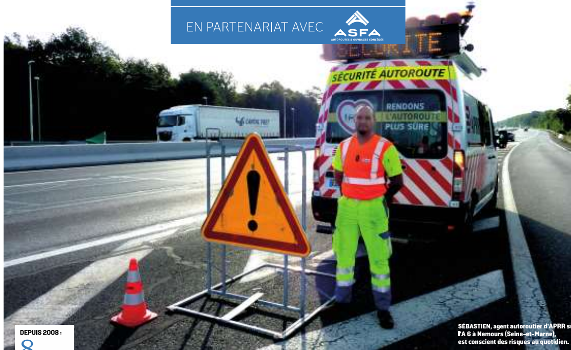
SÉBASTIEN, agent autoroutier d'APRR sur l'A 6 à Nemours (Seine-et-Marne), est conscient des risques au quotidien.