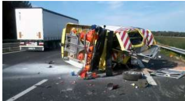
Lors d'un choc avec un camion, le fourgon des agents est projeté sur plus de 100 mètres.