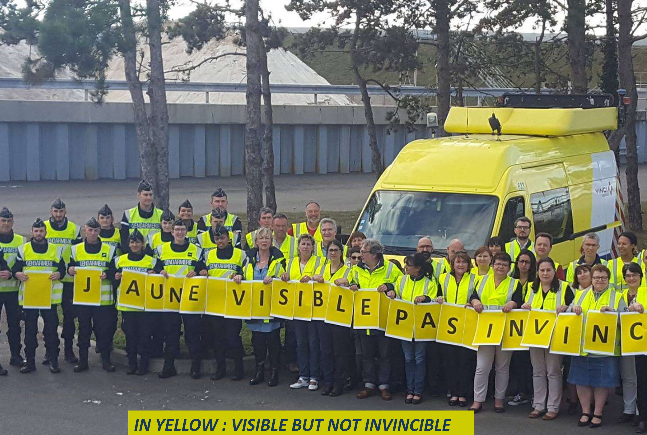
IN YELLOW : VISIBLE BUT NOT INVINCIBLE